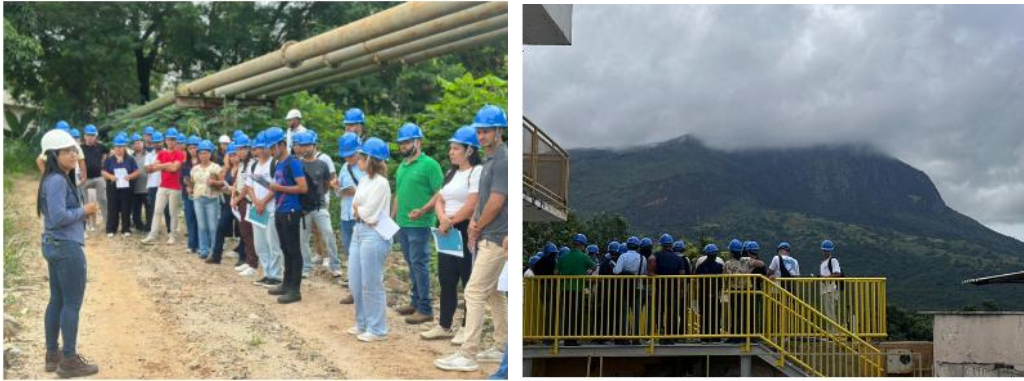
Figura 13 – Águas de Valadares recebe 50 agentes da Vigilância Sanitária para treinamento