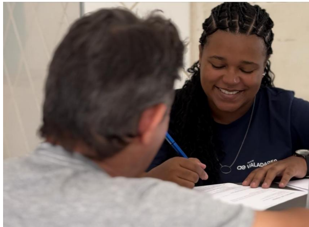
Figura 10 – Águas de Valadares oferece vagas em Mutirão de Empregos

Águas de Valadares oferece vagas em Mutirão de Empregos