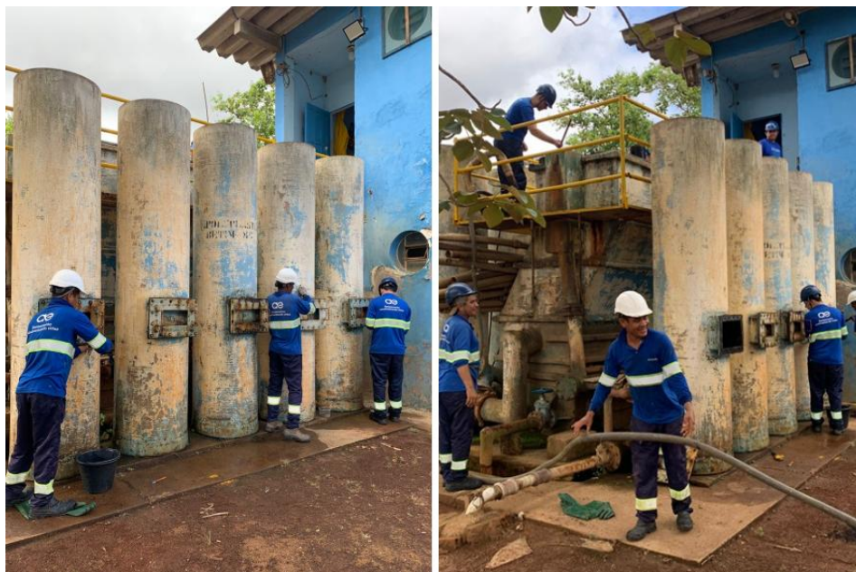
Figura 24 – Águas de Valadares faz melhorias no sistema de abastecimento de Pontal

Águas de Valadares faz melhorias no sistema de abastecimento de Pontal