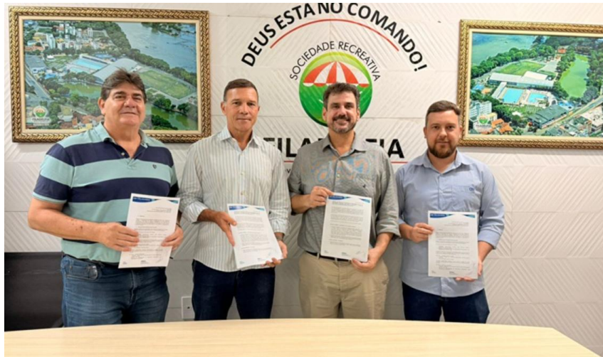
Figura 1 – Águas de Valadares e Clube Filadélfia firmam parceria