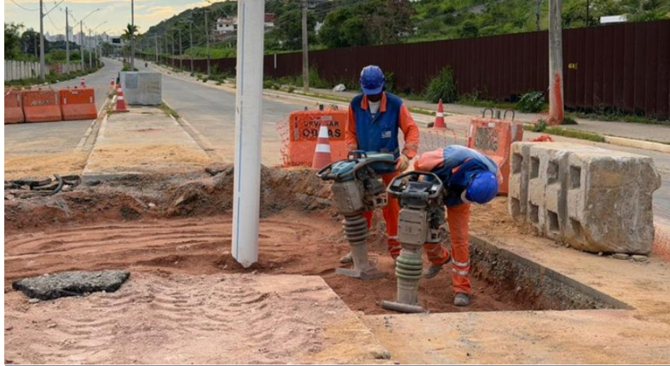
Figura 29 – Obras na rede de água da Moacir Paleta

Obras na rede de água da Moacir Paleta estão em fase final: melhorias beneficiam moradores de todo o sistema SIR