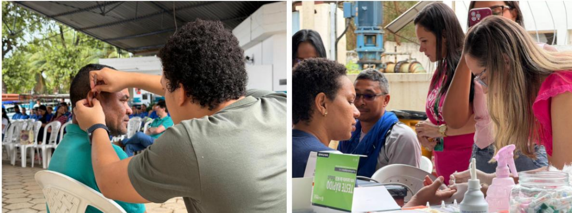
Figura 3 – Águas de Valadares reúne colaboradores para conscientizar sobre prevenção ao câncer de mama

Águas de Valadares reúne colaboradores para conscientizar sobre prevenção ao câncer de mama