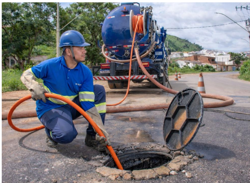
Figura 21 – Águas de Valadares divulga guia prático para evitar entupimentos e proteger as redes de esgoto

Águas de Valadares divulga guia prático para evitar entupimentos e proteger as redes de esgoto