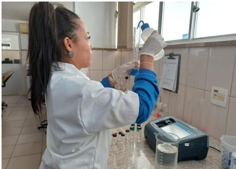
Figura 17 – Funed atesta água tratada distribuída em Valadares

Funed atesta água tratada distribuída em Valadares