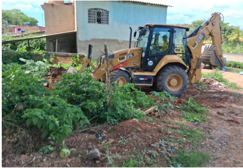
Figura 25 – Águas de Valadares iniciou a perfuração de um novo poço artesiano em Chonim de Cima