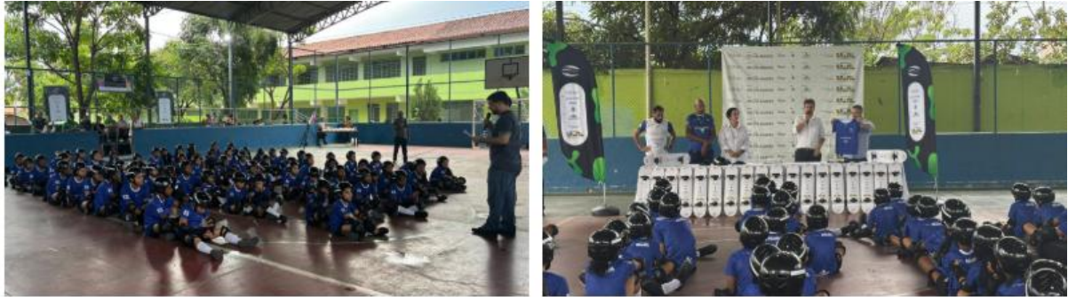
Figura 8 – Águas de Valadares entrega uniformes e equipamentos de segurança a skatistas do projeto Esporte na Cidade

Águas de Valadares entrega uniformes e equipamentos de segurança a skatistas do projeto Esporte na Cidade