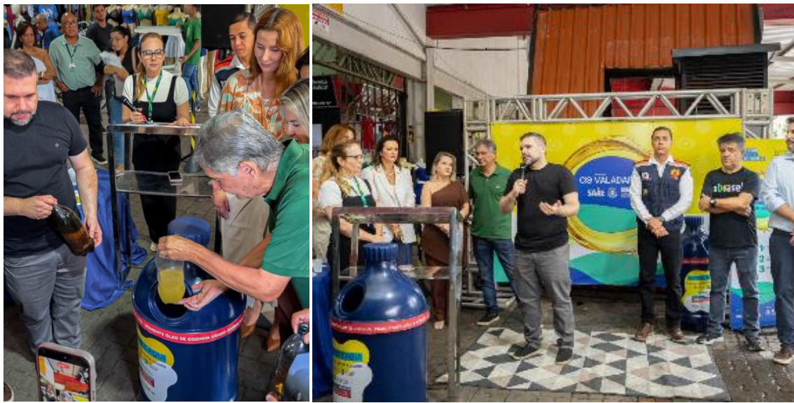
Figura 22 – a Semana da Água, Valadares ganha pontos para descarte correto de óleo de cozinha usado

Na Semana da Água, Valadares ganha pontos de descarte de óleo de cozinha usado