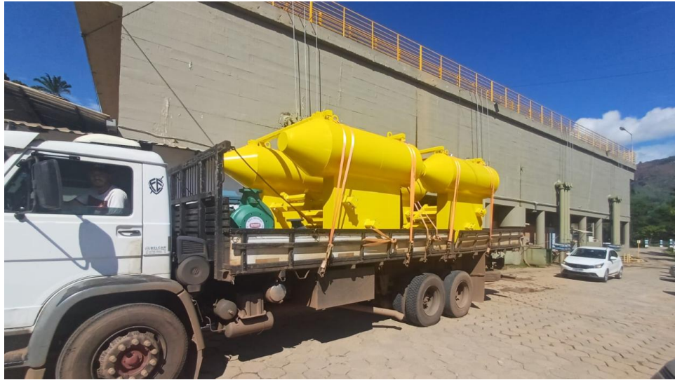
Figura 18 – Chuvas: Águas de Valadares executa Plano de Contingência e Emergência