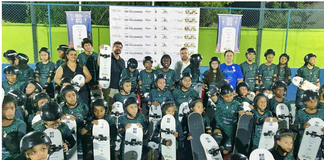
Figura 7 – Com apoio da Águas de Valadares e Prefeitura, projeto que une educação e skate será renovado no município

Com apoio da Águas de Valadares e Prefeitura, projeto que une educação e skate será renovado no município