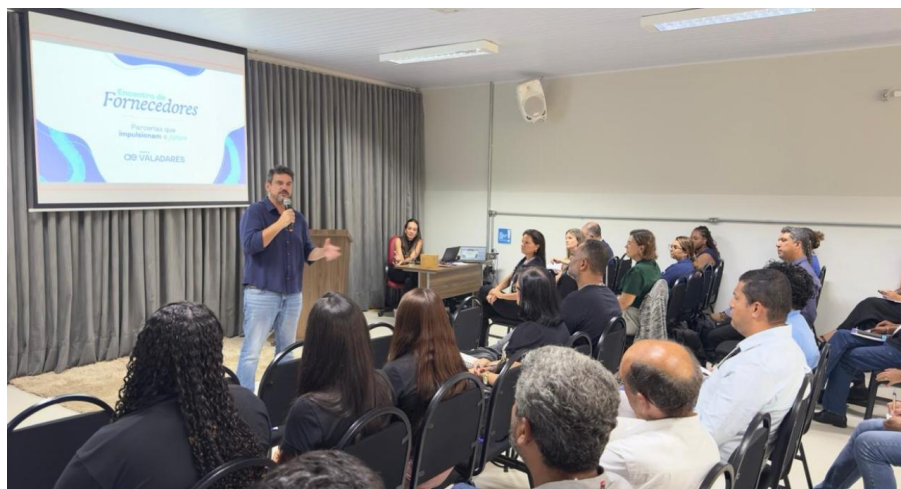
Figura 11 – Águas de Valadares realiza II Encontro de Fornecedores

Águas de Valadares realiza II Encontro de Fornecedores