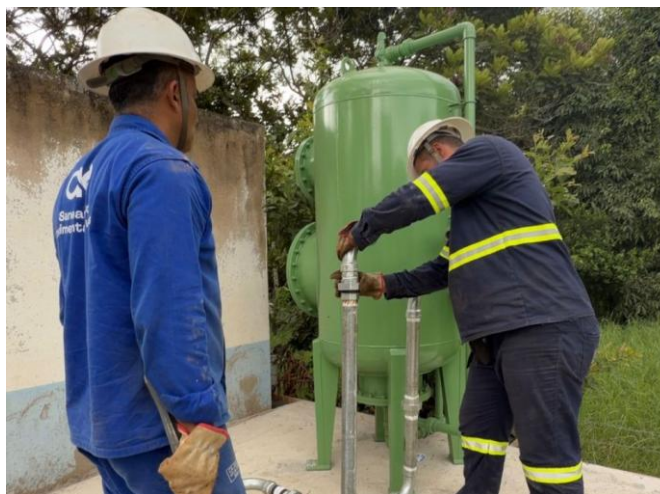
Figura 19 – Águas de Valadares instala filtros de zeólita nos distritos

Águas de Valadares instala filtros de zeólita nos distritos