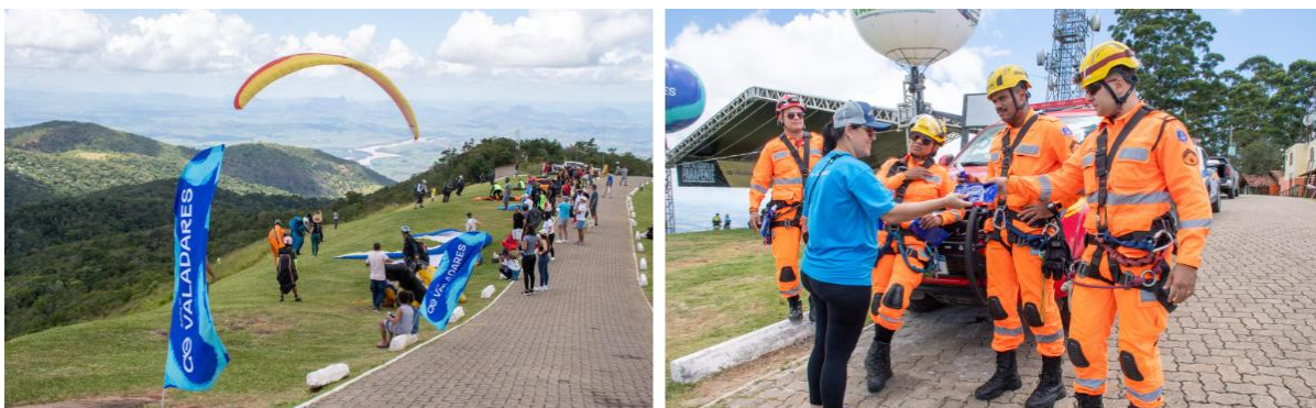
Figura 9 – Águas de Valadares é patrocinadora oficial da Copa Valadares de Parapente 2026

Águas de Valadares é patrocinadora oficial da Copa Valadares de Parapente 2026