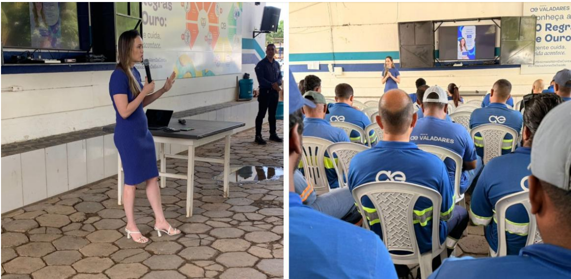
Figura 5 – Novembro Azul: Águas de Valadares promove manhã de conscientização

Novembro Azul: Águas de Valadares promove manhã de conscientização