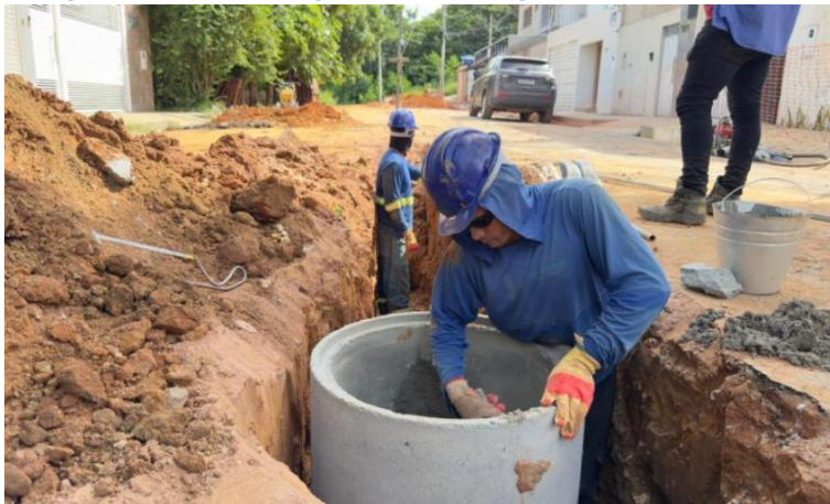
Figura 20 – Mais esgoto tratado: Águas de Valadares interliga novas redes de esgoto à ETE Santos Dumont

Mais esgoto tratado: Águas de Valadares interliga novas redes de esgoto à ETE Santos Dumont