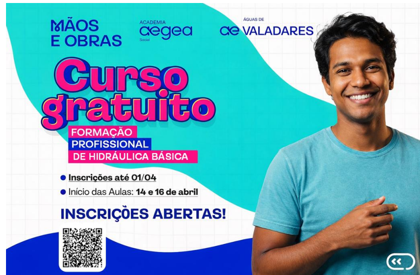
Figura 15 – Águas de Valadares abre inscrições para curso gratuito de hidráulica básica

Águas de Valadares abre inscrições para curso gratuito de hidráulica básica