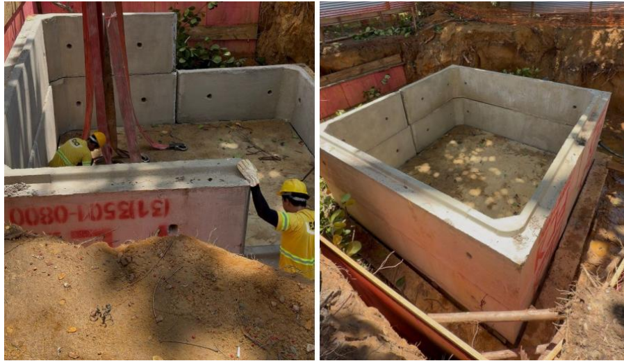
Figura 27 – Nova construção de elevatória no bairro São Pedro

Mais esgoto tratado: Águas de Valadares constrói elevatória no São Pedro