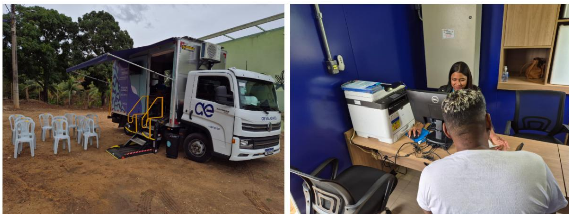
Figura 2 – Distritos recebem unidade de Atendimento Móvel da Águas de Valadares

Distritos recebem unidade de Atendimento Móvel da Águas de Valadares