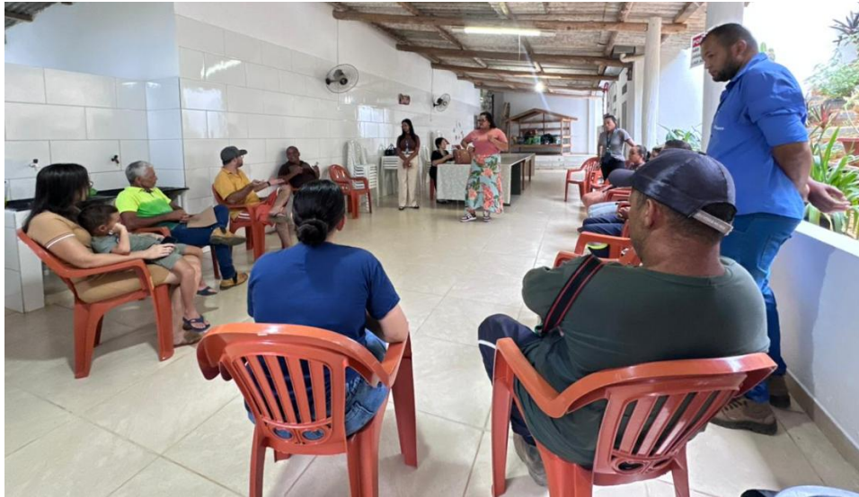
Figura 16 – Águas de Valadares leva equipe de multisserviços a Nova Floresta (Paca)