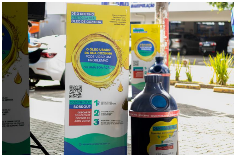
Figura 14 – Águas de Valadares lança programa “De Olho no Óleo”

Águas de Valadares lança programa “De Olho no Óleo” para evitar descarte de gordura na rede de esgoto