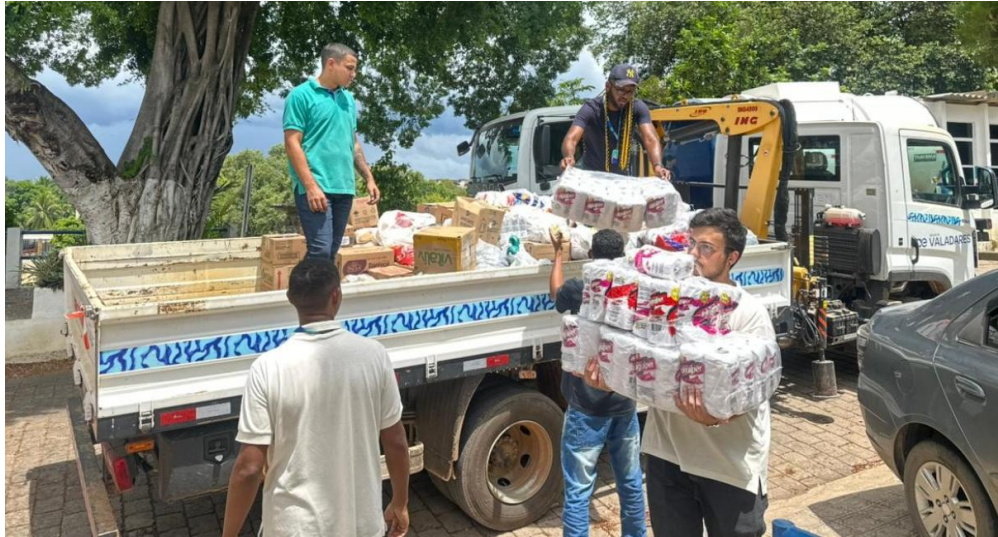
Figura 12 – Águas de Valadares arrecada toneladas de doações para vítimas do temporal em Juiz de Fora e Ubá

Águas de Valadares arrecada toneladas de doações para vítimas do temporal em Juiz de Fora e Ubá