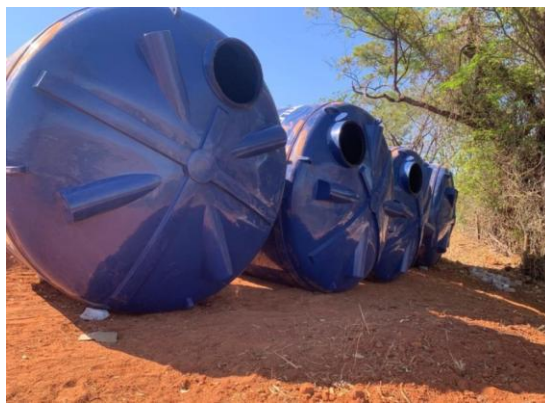
Figura 23 – Águas de Valadares faz melhorias no sistema de abastecimento de São Vitor

Águas de Valadares faz melhorias no sistema de abastecimento de São Vitor