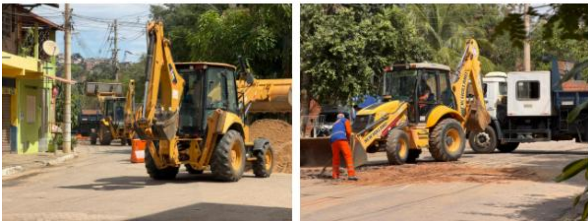
Figura 26 – Águas de Valadares faz melhorias no Turmalina com implantação de redes novas na rua Angico

Águas de Valadares faz melhorias no Turmalina com implantação de redes novas na rua Angico