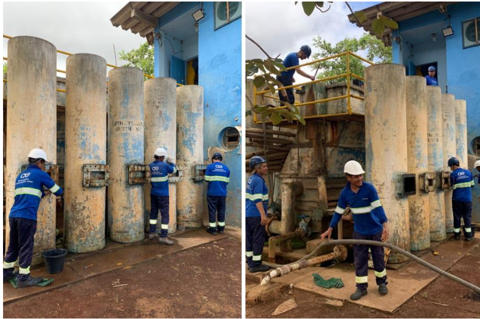
Figura 24 – Águas de Valadares faz melhorias no sistema de abastecimento de Pontal

Águas de Valadares faz melhorias no sistema de abastecimento de Pontal