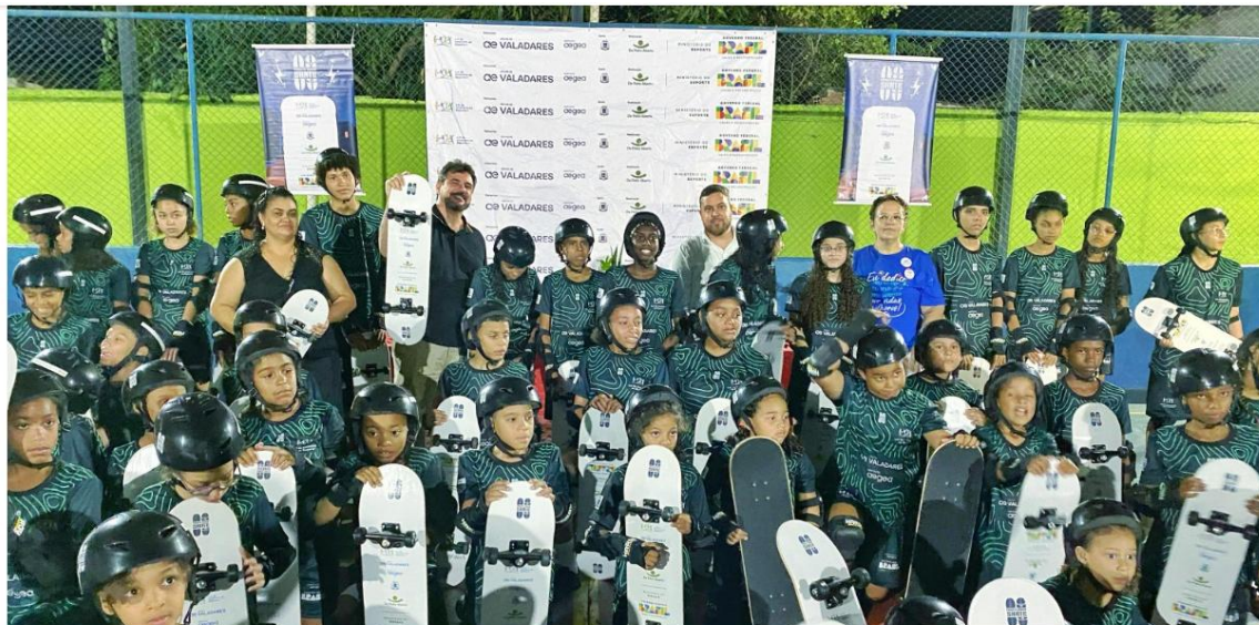
Figura 7 – Com apoio da Águas de Valadares e Prefeitura, projeto que une educação e skate será renovado no município

Com apoio da Águas de Valadares e Prefeitura, projeto que une educação e skate será renovado no município