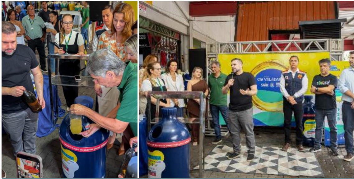
Figura 22 – a Semana da Água, Valadares ganha pontos para descarte correto de óleo de cozinha usado

Na Semana da Água, Valadares ganha pontos de descarte de óleo de cozinha usado