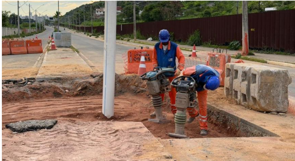
Figura 29 – Obras na rede de água da Moacir Paleta

Obras na rede de água da Moacir Paleta estão em fase final: melhorias beneficiam moradores de todo o sistema SIR