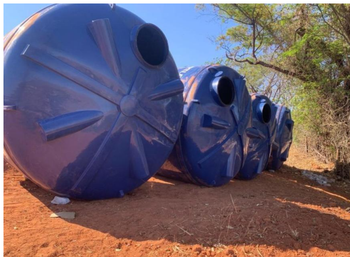
Figura 23 – Águas de Valadares faz melhorias no sistema de abastecimento de São Vitor

Águas de Valadares faz melhorias no sistema de abastecimento de São Vitor