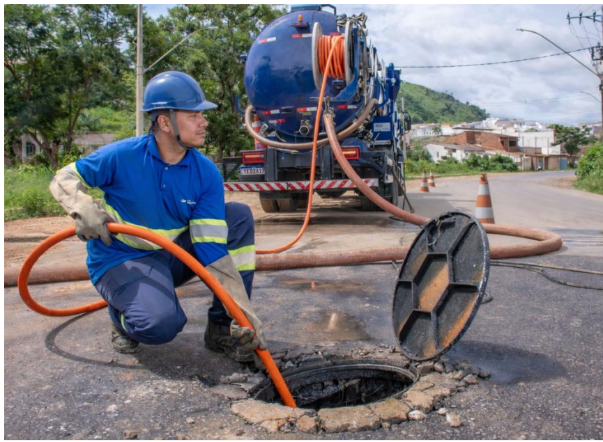
Figura 21 – Águas de Valadares divulga guia prático para evitar entupimentos e proteger as redes de esgoto

Águas de Valadares divulga guia prático para evitar entupimentos e proteger as redes de esgoto